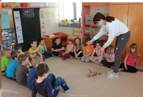
Mravljica na obisku.