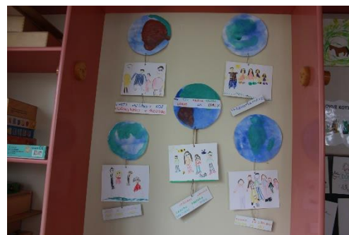
Naša slika Zemlje in napisani predlogi rešitev.