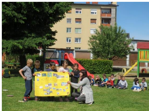
Napoved plesne zgodbe s pomočjo plakata