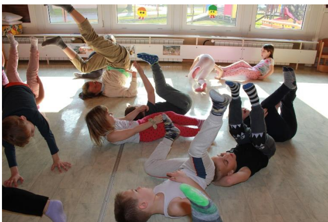
Plesalka v skupini. Ideje nizkega gibanja živali.

negujemo in razvijamo ustvarjalne potenciale v fazah doživljanja, zamišljanja, izražanja, komuniciranja in uveljavljanja na področju umetniških dejavnosti.