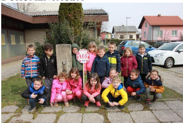
Čiščenje odpadkov in postavili opozorilni znak.