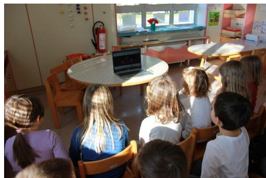
Ogled predstave Huda mravljica.