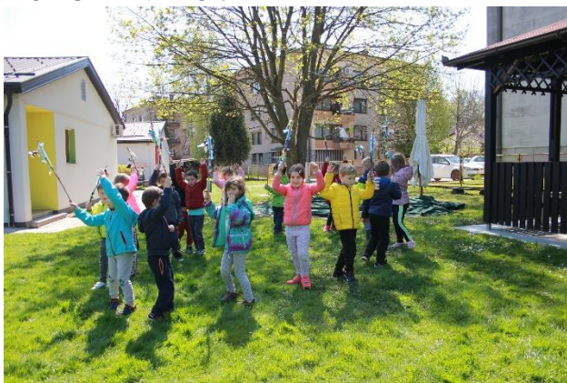
Ples s čarobnimi palicami v naravi.