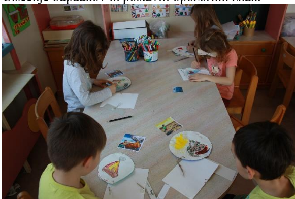
Risanje podnebnih sprememb.