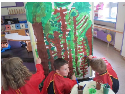
Izjava fanta: Na to drevo bo splezala huda