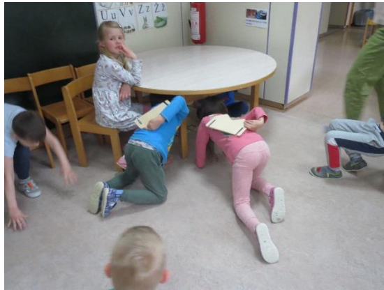
in jo nosijo v mravljišče