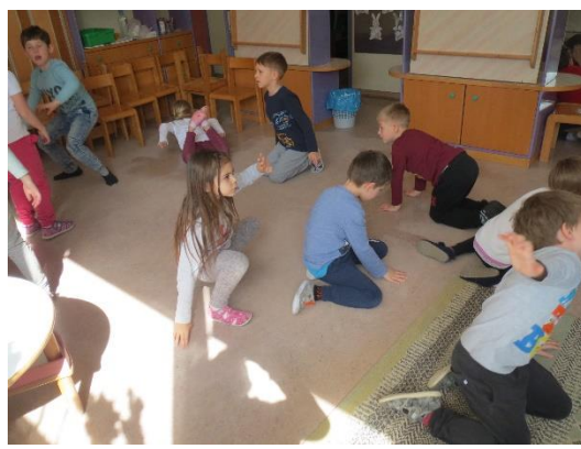
Tako so mravlje delavne, požrešne in radovedne