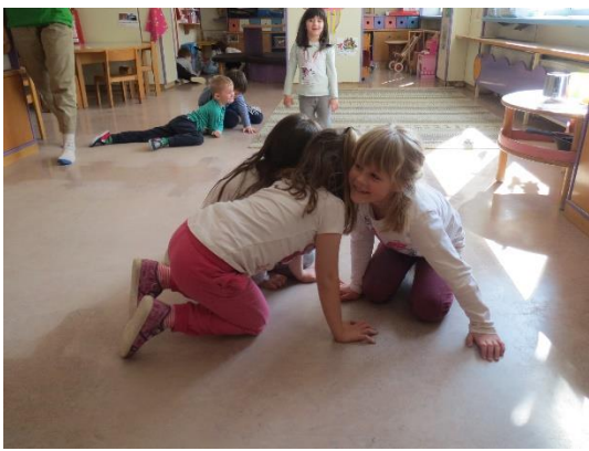
Tako se mravljice pozdravijo