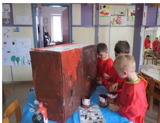
Pogovor med fanti: Poglej mravljice imaj okna