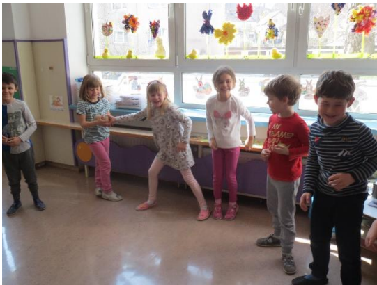
Tako si podajajo hrano